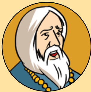
MITROPOLITUL ANTIM IVIREANUL