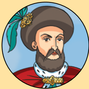
DOMNITORUL CONSTANTIN BRÂNCOVEANU