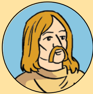
PICTORUL PĂRVU MUTU