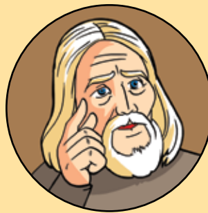
PROFESORUL ION ABRAMIOS