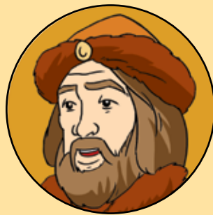
CRONICARUL RADU GRECEANU