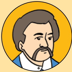
STOLNICUL CONSTANTIN CANTACUZINO